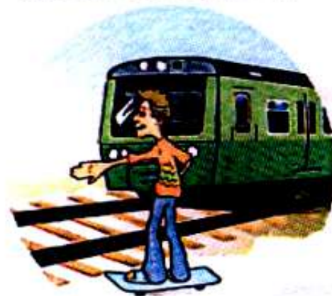
Кататься вблизи железной дороги.