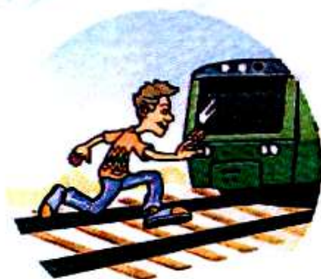
Перебегать пути перед поездом.

Слушать плеер и говорить по телефону, т. к. можно не услышать сигналы приближающегося поезда и объявления диктора.