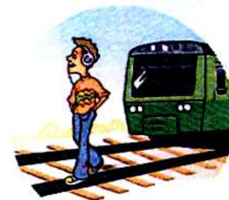
Слушать плеер и говорить по телефону вблизи железной дороги.