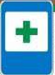
Знак "Пункт первой медицинской помощи"